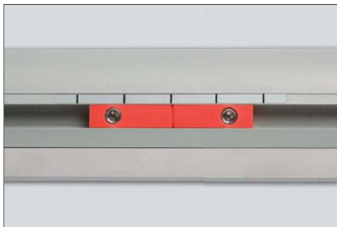
MTT REFERENCE INDEX INDICE DI RIFERIMENTO MTT

SELECTABLE with Zero Magneto Set or at constant step of 10 mm SELEZIONABILE con dispositivo Zero Magneto Set, o a passo costante di 10 mm