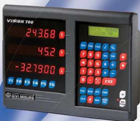
3 ASSI CON LCD